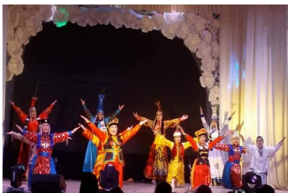
оролцож Тэргүүн байр эзэлсэн.

БСУГазар, аймгийн 6-р цэцэрлэгтэй хамтран аймгийн бүх СӨБ-ын дунд зохион байгуулсан “Багшийн хөгжил хамтын ажиллагаа” сэдэвт уралдааны хүрээнд багшийн хөгжил төв болон СӨБ-ын багш нарын авьяас, хууль эрх зүйн мэдлэгийг сорьсон 3 төрлийн тэмцээнд амжилттай