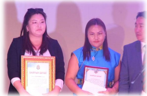
ээр-2 багш тус тус шагнагдсан.