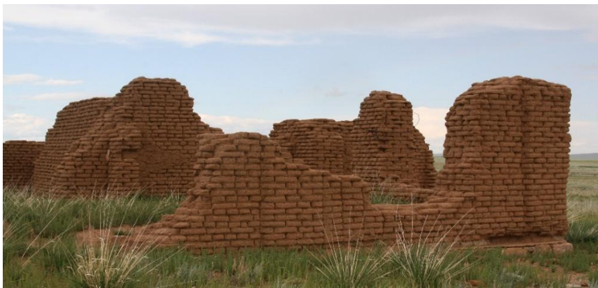
Чойрын хүн чулуу

Говьсүмбэр аймгийн төвөөс 15км орчимд байх Сансар хайрханы орчмоос 1928 онд олдсон түргийн үеийн дурсгал болох Чойрын хүн чулуу нь одоогоор Монголын Үндэсний Түүхийн музейд “Чойрын хүн чулуу” – нэрээр хадгалагдаж байна. Энэ хүү дурсгал нь 700 - 715 оны үед холбогдох юм хэмээн эрдэмтэд таамагладаг. Эртний Түрэгийн рүни бичгээр 72 ширхэг үсэг сийлж, янгир дүрст 2-3 тамга дүрслэжээ. Түрэг судлаач эрдэмтдийн анхаарлыг татсаар ирсэн бичигт хүн чулууны бичээсийг анх тайлан унших оролдлого хийсэн судлаач бол Монголын эрдэмтэн Б.Ренчин нар юм.