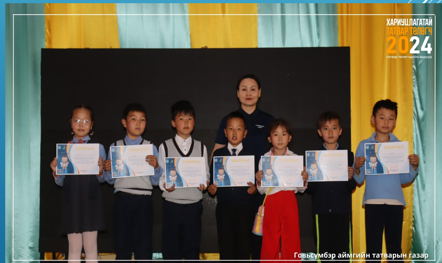
Говьсүмбэр аймгийн татварын газар