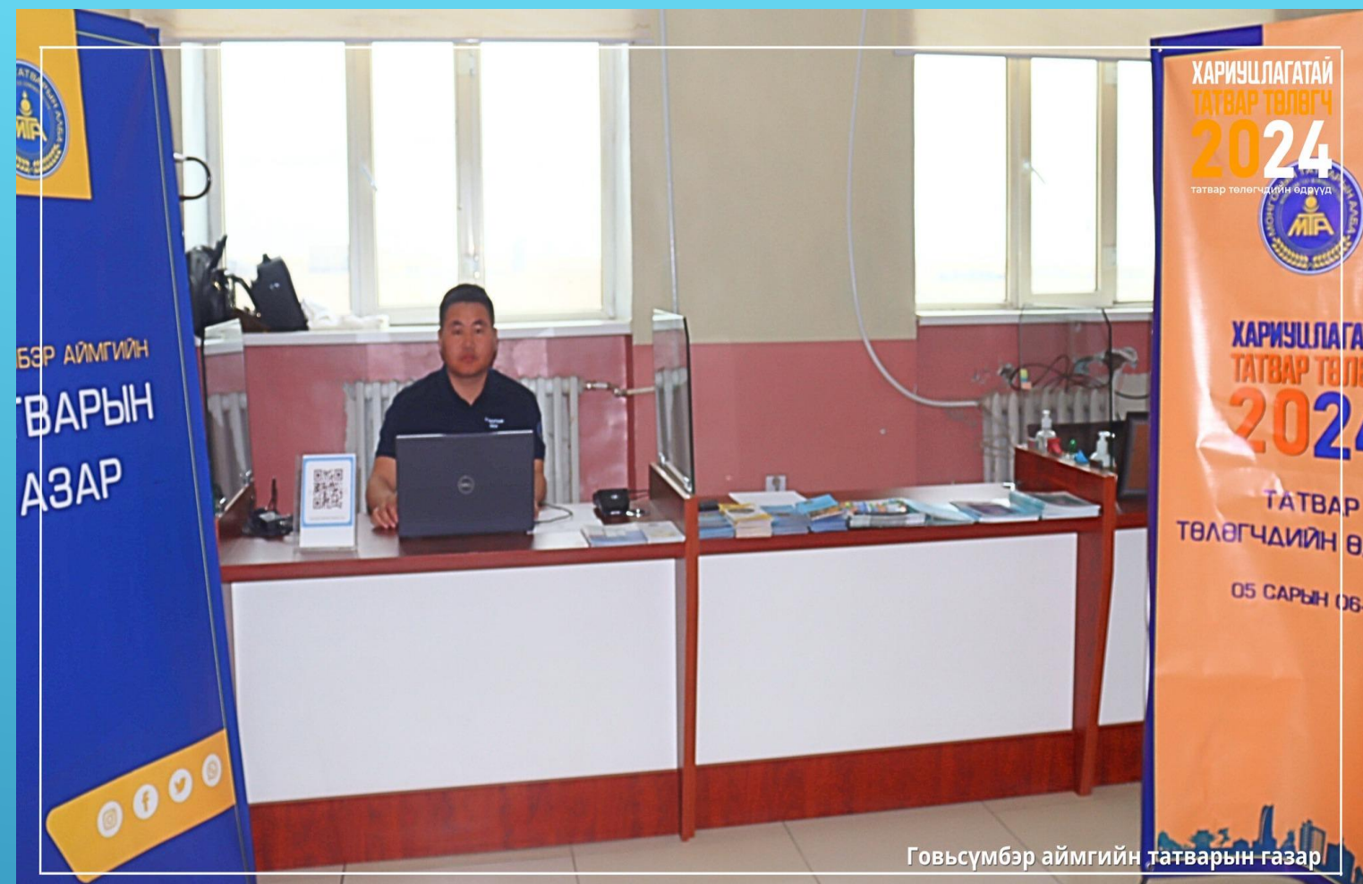
Говьсүмбэр аймгийн татварын газар

тохиолдуулан аймгийн Татварын газар сумын ЗДТГазартай хамтран 2024 оны 05 дугаар сарын 08-ны өдөр сумын Засаг даргын Тамгын газарт иргэдэд мэдээлэл хүргэн ажиллалаа. Тус өдөрлөгөөр сумын аж ахуйн нэгжүүдэд болон иргэдэд татварын мэдээ мэдээлэл хүргэж, татвар төлөгчдөд зөвөлгөө мэдээлэл өгч ажиллав. Мөн сумын ерөнхий боловсролын сургуулийн бага ангийн сурагчдад "Татвар хөгжлийн үндэс" сэдэвт гар зургийн уралдаанд орлцсонд талархал гардууллаа.